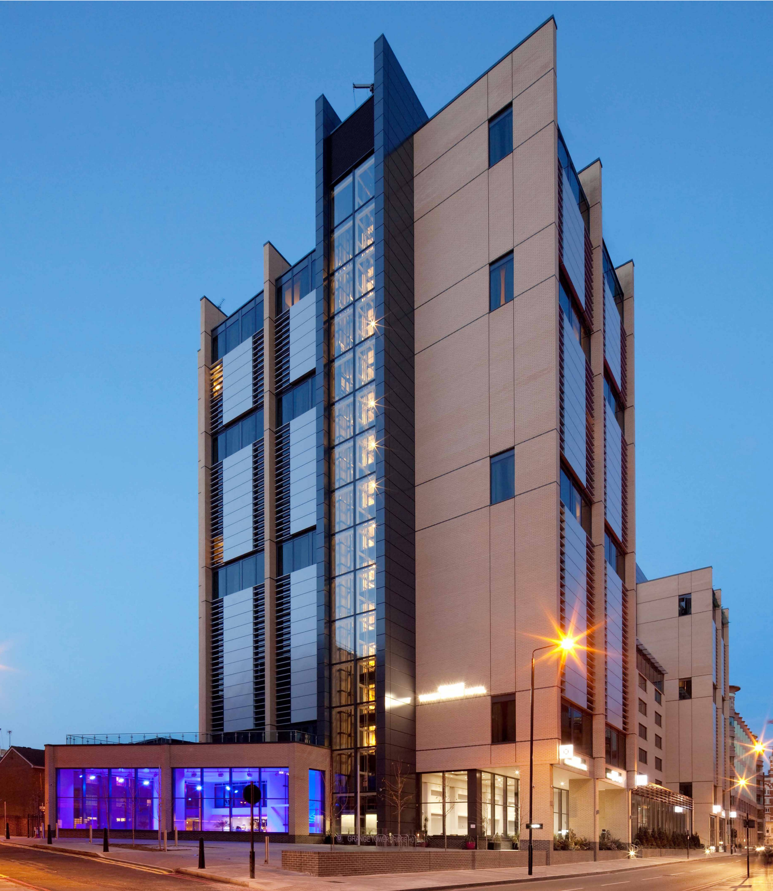
Dobler Metallbau | Fassaden und Fenster aus Aluminium und Glas