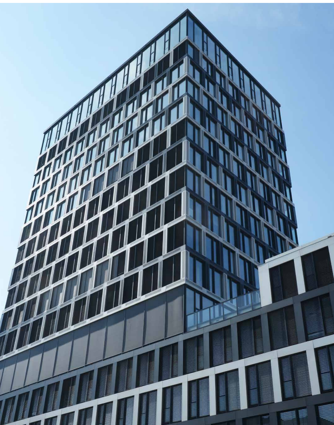
Übergang Hochhaus zu Flachbau