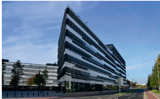
Links Bauteil B und rechts Bauteil C

Dobler Metallbau realisierte den Auftrag in einer Arbeitsgemeinschaft mit der Scheffer Metallbau GmbH und zeigte sich verantwortlich für zwei Flachbauten sowie das Hochhaus. Der Auftrag wurde am 07. Mai 2011 erteilt und bereits zum Jahresende war die Fassade gemäß vertraglicher Vorgabe dicht. Ca. 37.000 m 2 Fassade in nur 8 Monaten von der Planung bis zur Montage der komplett vorgefertigten Elemente. Ein herausragender Kraftakt, der alle Beteiligten, nicht zuletzt wegen der eingehaltenen Qualitätsstandards von Dobler, mit großem Stolz erfüllt.